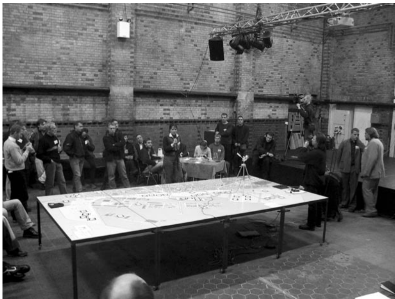
Pause i Havnespillet i Turbinehallen, 8. november 2002.

I en diskussion omkring redskaber og metoder til brugerinddragelse er lukket//åben-aksen væsentlig at fokusere på. Ikke mindst fordi det er på denne akse, at førnævnte distinktioner mellem på den ene side – i hvert fald i udgangspunktet – demokratiske planlægningsprocesser og på den anden side kommercielle designprocesser befinder sig. En byplanlægningsproces, der i sidste ende involverer måske hundredetusinder af borgere og andre interessenter, bør som udgangspunkt befinde sig længere oppe ad skalaen end en designproces, der sigter mod udviklingen af f.eks. et IT-ekspertsystem med nogle få tusinde brugere. Men ved at trække redskabet op ad lukket//åben-aksen mod en større grad af åbenhed, kommer man også meget let til at trække den op ad de øvrige akser mod et større mål af tilfældighed og spil. Dermed undermineres anvendeligheden af redskabet i en planlægningsmæssig sammenhæng – det var i hvert fald vores erfaring i Havnespillet . Men hvorfor egentlig det?